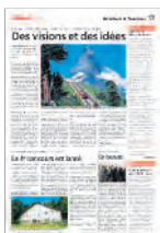
Hôtellerie / Tourisme