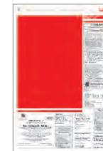
Tabloid 201x300 mm