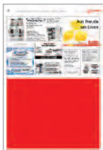
1/2 Seite quer 290x220 mm