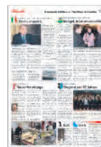
Kantonale Sektionen / Sections cantonales