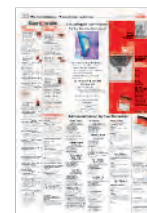
Weiterbildung / Formation continue