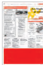
1/4 Seite quer 290x110 mm