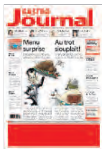
Frontseite 1. und 2. Bund 290x70 mm