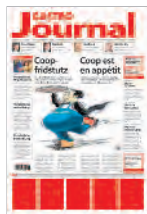
Frontseite 1. und 2. Bund 54x70 mm