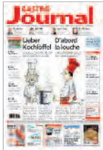
Frontseite 1. Bund