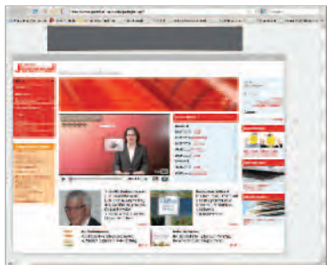
Leaderboard 728x90 Pixel