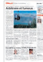
Frontseite 2. Bund Gros Plan