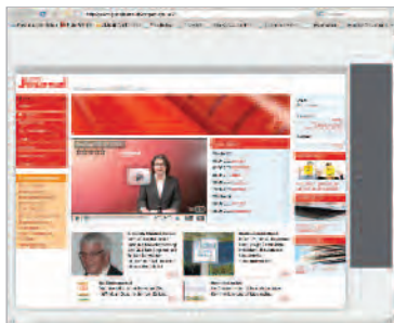
Skyscraper 120x600 Pixel