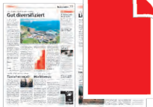
Lose Einzelseite 1. oder 2. Bund 290x440 mm