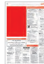
1/4 Seite hoch 143x220 mm