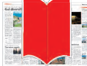
FreePage 1. und 2. Bund 4x 143x440 mm (je Seite 1 und 4) 2x 290x440 mm (je Seite 2 und 3)

Nur unter bestimmten technischen Voraussetzungen möglich