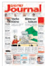
Frontseite nur 1. Bund 45x40 mm