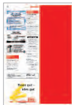
1/2 Seite hoch 143x440 mm