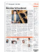
Schlusspunkt / Point final