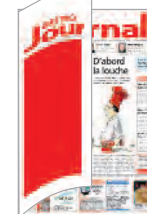
FreeFront 1. und 2. Bund 1x 160x372.5 mm 3x 160x440 mm

Nur unter bestimmten technischen Voraussetzungen möglich