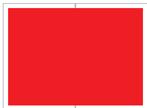
Panorama 1. oder 2. Bund 610x440 mm