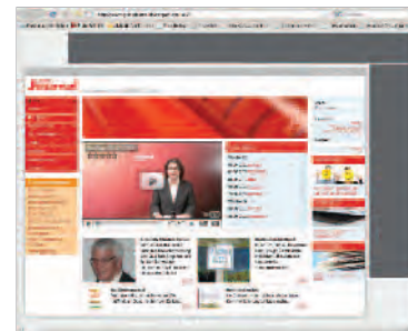
Wallpaper 728x90 Pixel und 120x600 Pixel