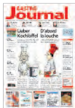
1 re page du 1 er cahier