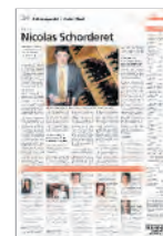
Schlusspunkt / Point final