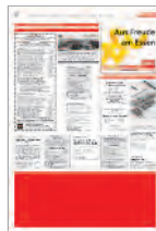
1/4 page horizontale 290x110 mm