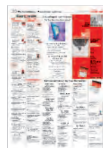
Weiterbildung / Formation continue