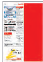
1/2 page verticale 143x440 mm