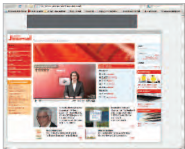
Leaderboard 728x90 pixels