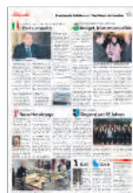
Kantonale Sektionen / Sections cantonales