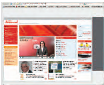
Skyscraper 120x600 pixels