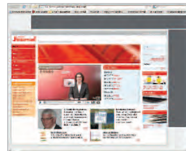
Wallpaper 728x90 pixels et 120x600 pixels