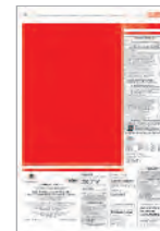
Tabloïd 201x300 mm