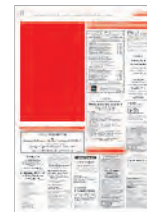
1/4 page verticale 143x220 mm