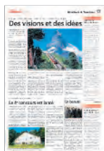
Hôtellerie / Tourisme