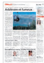
1 re page du 2 e cahier Gros Plan