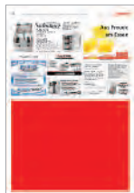
1/2 page horizontale 290x220 mm